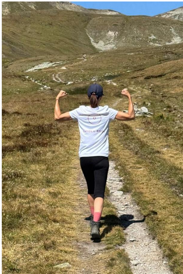
N.B. das bin nicht ich

Wir starten auch diesmal mit einem Tisch voller Ideen ins neue Jahr.