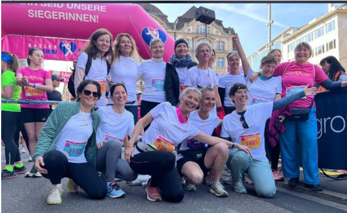
TAVOLA ROSA BASEL war gut sichtbar und konnte vielen Läuferinnen und Interessentinnen Informationsmaterial abgeben oder sie im persönlichen Gespräch über unsere Initiative und Angebote aufklären.

Bereits zum 5. Mal waren wir mit einem TAVOLA ROSA Team, bestehend aus 15 Teilnehmerinnen und Helferinnen, beim Rennen und mit eigenem Stand und unserem Zelt am Marktplatz vertreten.