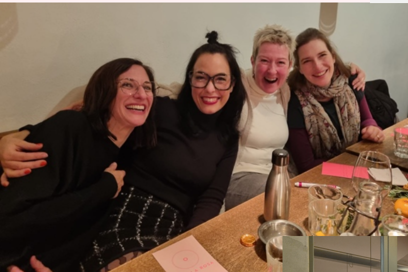
TAVOLA ROSA X-MAS

Das diesjährige Weihnachtsessen fand im Rostigen Anker statt. Mit einer stimmungsvollen Weihnachtsgeschichte und feinem Essen verbrachten wir 30 Frauen einen schönen Abend und somit eine wunderbare Abschlussveranstaltung 2023.