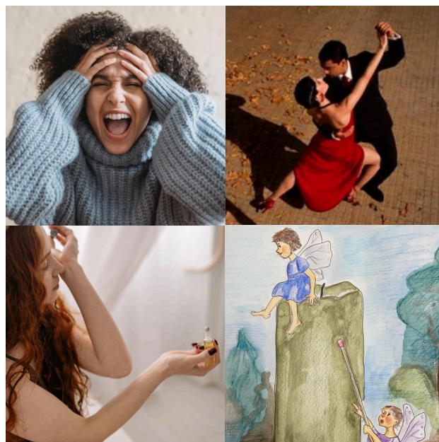
TAVOLA ROSA BLOG